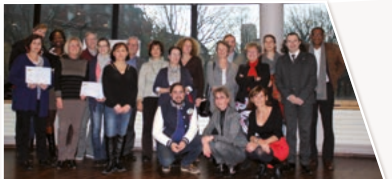
▶ Les lauréats d'objectif solidarité 2015 • Novembre 2015