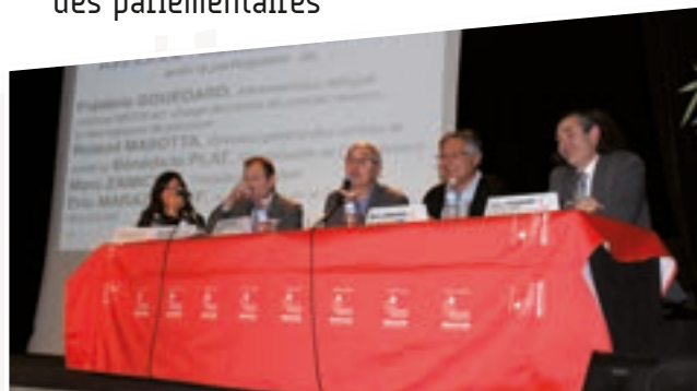
▶ Conférence sur les SSAM • Octobre 2015