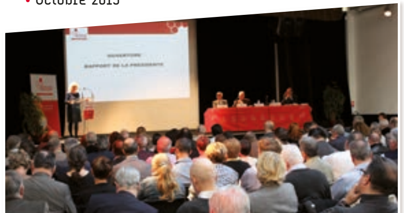
▶ Assemblée générale • Octobre 2015