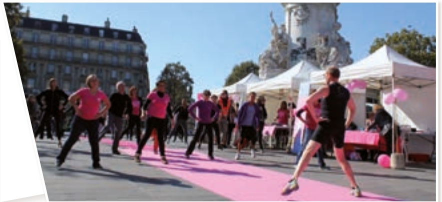
▶ Lancement d'octobre rose, place de la République • Octobre 2015